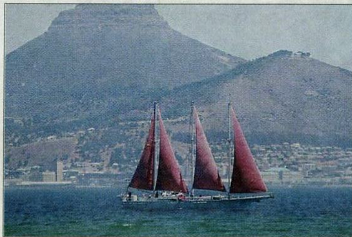
J. PÉREZ CURBELO

Pegasus durante su travesía por Sudáfrica.